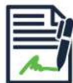
Plik JPK wygenerowany z tos